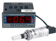
Easidew Online 在线露点仪