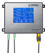
Optidew 501 冷镜式露点仪